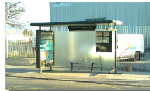
Nouvel abribus " Les Paluds "