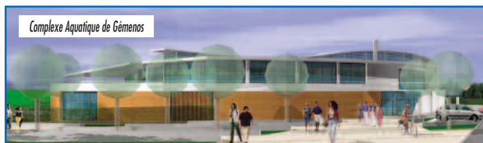
Complexe Aquatique de Gémenos

Fort du talent affiché sur les références anciennes ou en cours (Mairie de Gémenos, Caserne des Pompiers, A.R.E.A., Complexe Aquatique de Gémenos, etc...), le Cabinet "2G ARCHITECTURES - SAUTEREAU" gagnera la confiance de nouveaux grands donneurs d'ordres, tels que : Mairie de Marseille, Mairie de Toulon, Ministère de la Justice, Marseille Aménagement, Conseil Général 13,