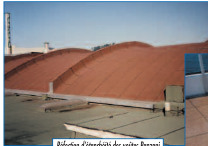
Réfection d'étanchéité des voûtes Panzani

Créée en 1978, REJET ETANCHE s'est installée sur le Parc d'Activités dans les années 90. Ses spécialités sont l'étanchéité et isolation thermique des toitures et terrasses, des parkings, des terrasses jardins, et des murs enterrés, tant en travaux neufs qu'en rénovation. REJET ETANCHE s'est vraiment spécialisée dans cette dernière activité.